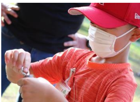
子どもが簡単に作れるバードコール