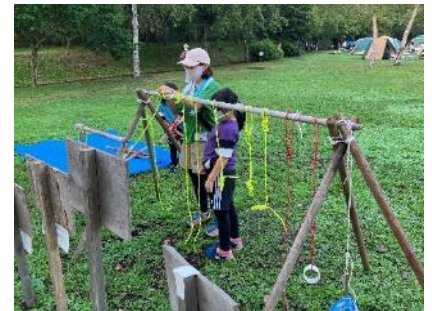
自由にロープワークができるコーナー