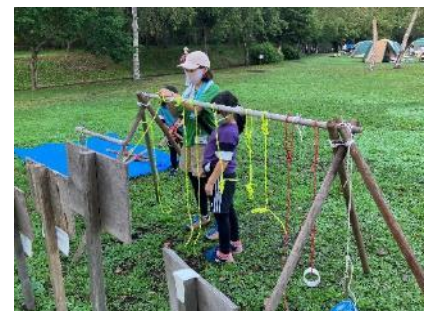
自由にロープワークができるコーナー