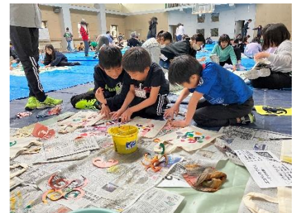
友人と一緒に作るエコバッグ