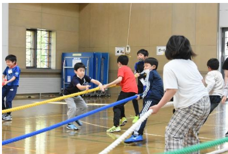
他班と協力して行った五色綱引