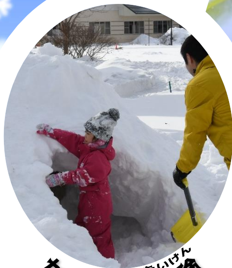
かまくら たいけん 体験