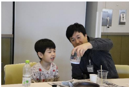
スノードーム作り