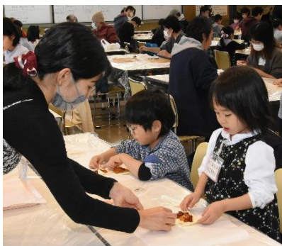
スウェーデンのクリスマスの 定番お菓子づくり