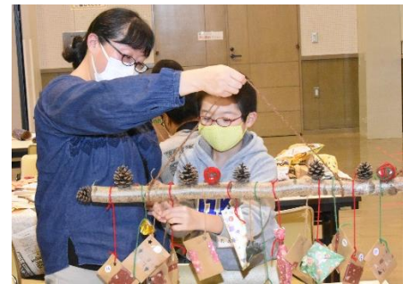
クリスマスまでの期間を楽しむ アドベントカレンダーづくり