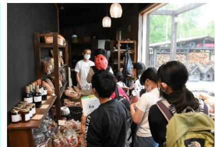
直接体験を通じた生産者との交流