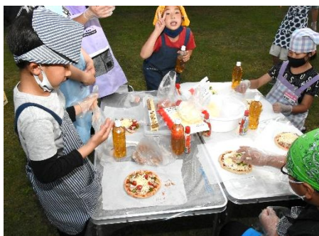
地元の方法を使ったピザ作り