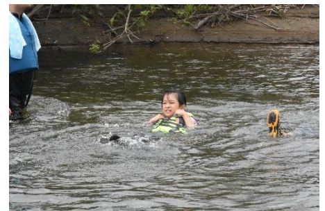
川流れをする参加者