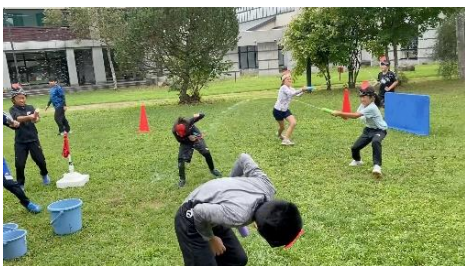
盛り上がった水鉄砲合戦