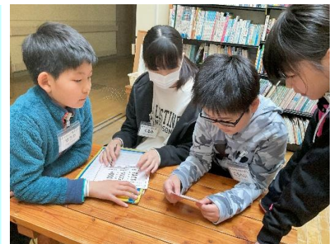
謎を解きながら楽しく交流