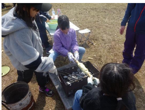
バウムクーヘンづくりに挑戦